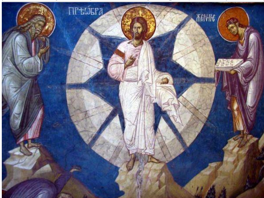
Преображење Господње / Holy Transfiguration of Jesus Christ