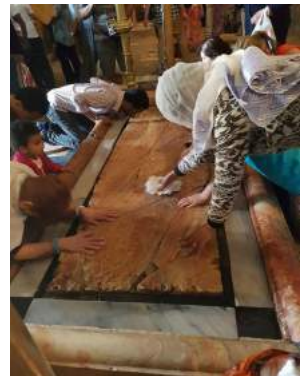
Плоча на коју је скинут Христос са крста и на којој је помазан пре сахране