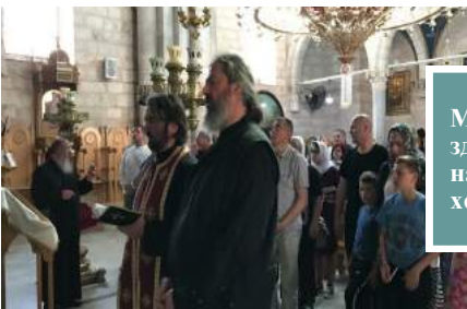
Молитва за здравље наших ходочасника