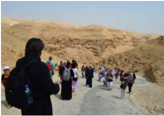
Силазак наше групе низ литице канона према манастиру Светог Георгија Хозевита.

највећих светитеља православља, а женски део остаје у пиргу манастира и слуша о историји манастира од одређеног монаха који је сестрама на поклон даривао иконе Св.