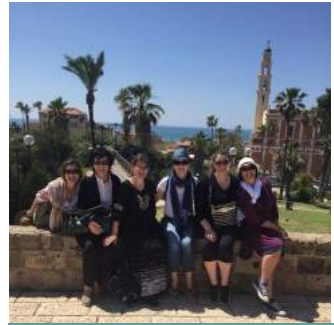
Наше парохијанке приликом кратког предаху у Старом Граду Тела Авиву.

У предвечерњим сатима стижемо у Лиду на поклоњење гробу св.