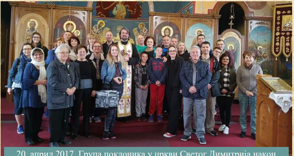
20. април 2017. Група поклоника у цркви Светог Димитрија након прочитаног молебана за благословен и серетан пут у Свету Земљу.