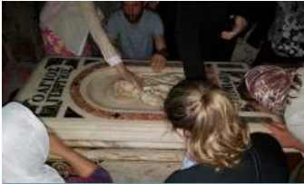
Наши ходочасници на гробу светог Георгија у Лиди.

људи сличан животу људи западне цивилизације.