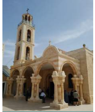
Манастир Св. Теодосија на излазу из Витлејема у Јорданску пустињу.

који се налази у срцу Јудејске пустиње а сам манастир је права духовна оаза уз коју тече поток Кедрон. У време Св. Саве, оснивача манастира, било је и по пет хиљада монаха у манастиру.