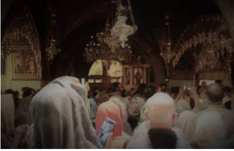
Поноћна Литургија на Голготи, месту страдања Христовог.

и други православни верници ка храму Васкрсења. У поноћ, уз звуке клепала, почело је јутарње Богослужење. За време трајања Јутарње службе наши верници су стајали у реду за улазак у гроб Господњи. По сведочанству већине поклоника, тренутак уласка у гроб Христов је један од најјачих осећаја који су икад у животу доживели и који се не