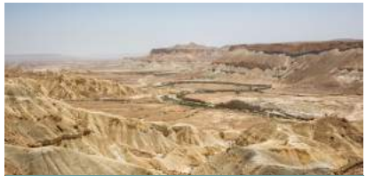
Јорданска пустиња. Место настанка православног монаштва. Обитавалиште многих великих испосника кроз све векове хришћанске цркве.

Око два сата ујутро, огласила су се звона за почетак литургије. Нас око 20 свештеника је служило Свету