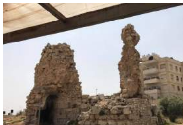
Остаци куће Марије, Марте и Лазара, пријатеља Христових у којој је Христос био гост.

сви заједно 7 дана живели као једна велика хришћанска породица.