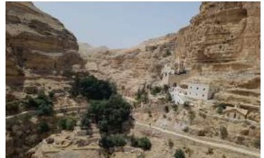
Манастир Георгија Хозевита. Чудесна лепота у стени.

Саве Освећеног и ватице натопљене светим уљем божанског мириса. Након манастира Св. Саве обилазимо манастир Св. Теодосија и потом одлазимо у Јорданску долину где посећујемо манастир Светог Георгија