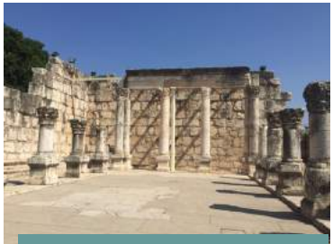
Бела Синагога у Капернауму у којој је Христос проповедао.

Ходимо стопама Христовим и обилазимо Табуху, цркву где је Господ умножио хлебове и