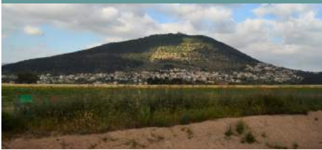
Гора Тавор. Место преображења Господњег.

Галилејској где смо посетили цркву Св. Ђорђа на месту првог Христовог чуда претвања воде у вино на свадби. Обилазимо разноврсне православне сувенирнице где нас домаћини часте чувеним галијеским вином. Одатле се