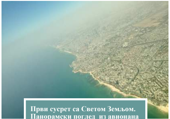
Први сусрет са Светом Земљом. Панорамски поглед из авиона на Тел Авив.

Група је на аеродрому топло дочекана од представника агенције “Вија Јерусалим”. Одмах по изласку са аеродрома, упутили смо се за Јерусалим где нас је чекала група верника из Србије.