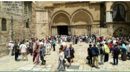
Храм Христовог Васкрсења у Јерусалиму

су се спремали да уђу у храм. Најпре се сусрећемо са местом где је Господ положен и помазан након распећа. То је у суштини камена плоча из које свакодневно излази свето миро. Обилазимо место бичевања Христа и јерменску хришћанску капелу у храму. Због превелике гужве, поклоњење гробу Господњем и месту распећа, остављамо за ноћни долазак у храм и упућујемо се у даљи обилазак светих места. Посећујемо, руску цркву св. Александра Невског, Сионску гору и Горњу собу где је обављена Тајна Вечера, тј место где је Господ установио евхаристију. Обилазимо јеврејску четврт и римски Кардо и видели смо остатке Иродовог храма и Западни зид ( Зид плача) иза којег су, унутар темеља јудејског храма подигнуте две велике џамије.