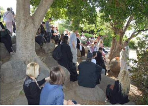
Гора блаженства. Место на коме је Христос изрекао молитву Оче Наш и Блаженства.

рибу и нахранио пет хиљада људи . Одмарамо се на Гори Блаженства и слушамо читање из Јеванђеља по Матеју, Христове беседу о блаженствима изречену на овој светој гори.