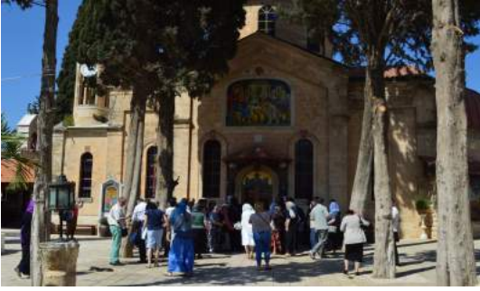
Ходочасници на месту првог чуда Христовог, претварања воде у вино у Кани Галилејској

Виндзора, и обред који су служили српски свештеници и старешина благовештенског храма. Наш хор је овде добио прилику да песмом узвелича Господа тако да је служба венчања, иначе служена комбиновано на српском и арапском језику, код свих нас изазвала посебна осећања. Из Назарета се упућујемо према Кани