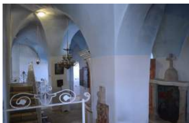
Кућа у у којој је некад живео Св. Никола. Над њом је данас направљена црква св. Николе. Налази се у хришћанском делу