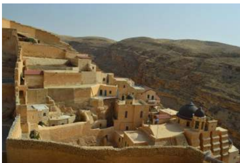
Манастир Св. Саве Освећеног у Јорданској пустињи.

Последњи дан нашег путовања, поранили смо и кренули у Јорданску пустињу. Одлазимо у православни манастир Светог Саве Освећеног