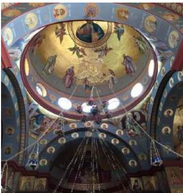
Православни манастир на месту чудесног умножења хлебова на Галилеском језеру. На полијелеју двоглави орао са 4. слова С.