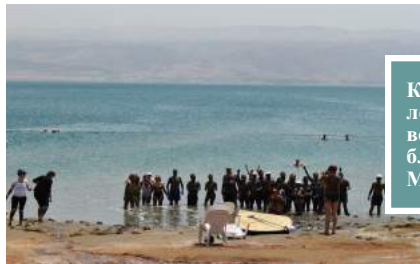
Купање у лековитим водама и благу Мртвог мора.

У недељу ујутро, након краћег сна, упутили смо се ка Јорданској пустињи. Са 900 метара надморске висине на којој се