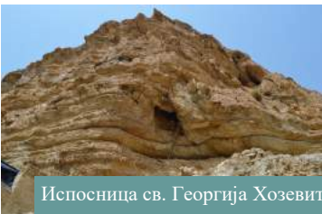
Испосница св. Георгија Хозевита.

Величанствени манастир у стени са моштима Светог Георгија Хозевита и са пећином пророка Илије код свих нас изазива посебан осећај захвалности што смо