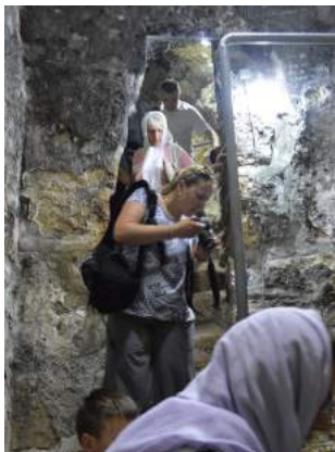
Силазак у гробницу Лазара којег је Христос васкрсао.

За крај нашег поклоничког путовања, посетили смо и цркву Светог Николе у Витлејему саграђену на кући у којој је 10 година живео Свети Никола.