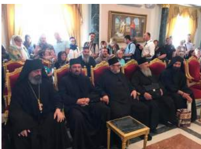
Наша група је имала ту част да нас прими Његова Светост патријарх Јерусалимски Г. Теофил и да нам уручи хаџијске грамате.

великом побожношћу целивају. Сви наши ходочасници су имали јединствену прилику да целу литургију проведу у пећини рођења Христовог и да се још једном причесте Телом и Крвљу Господњом. Након литургије, поново одлазимо у Јерусалим на пријем код Његове Светости патријарха Јерусалимског Г. Теофила. Патријарх нас је све поздравио прелепом беседом и благословио свештенике са седефним напрсним