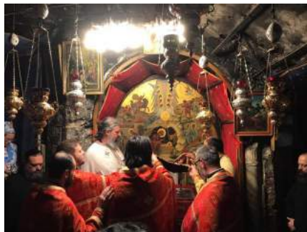
Света Литургија у пећини Христовог Рођења у Витлејему. Сви наши ходочасници су имали прилику да се причесте на самом извору живота.

Рано ујутро, крећемо брдовитим и уским улицама Витлејема на Св. Литургију, у цркву Христовог Рођења Господњег са два олтара. Величанствена литургија служи се у пећини рођења на грчком, арапском, руском и српском језику. Наши свештеници поново служе са православном браћом а испод олтара звезда од мрамора и сребра коју сви верни радосно и са